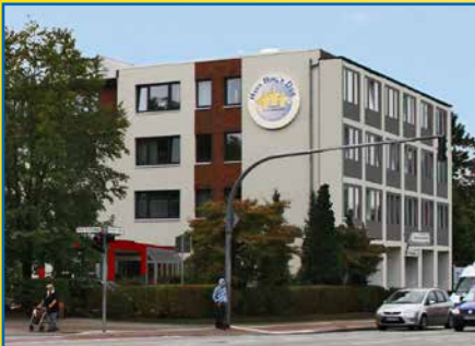
Haus Hog'n Dor Norderstedt