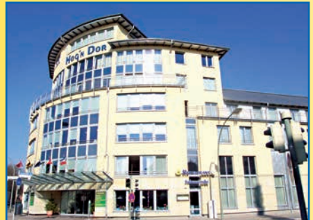
Restaurant & Café FRIESENSTUBE im Haus Hog'n Dor Neumünster