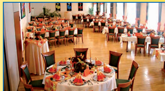
Der große Festsaal