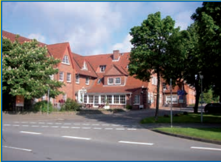
Haus Hog'n Dor Westerrönfeld

Haus Hog'n Dor Neumünster Klaus-Groth-Straße 37 24534 Neumünster Tel.: 04321/20046-0, Fax: -184 Email: nms@haushogndor.de www.haushogndor.de