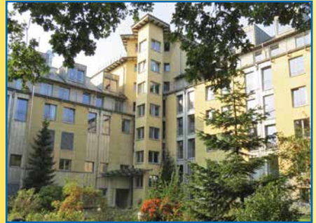
Haus Hog'n Dor Neumünster (Innenhof)