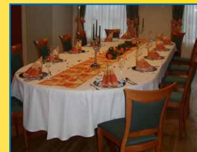
Der kleine Saal